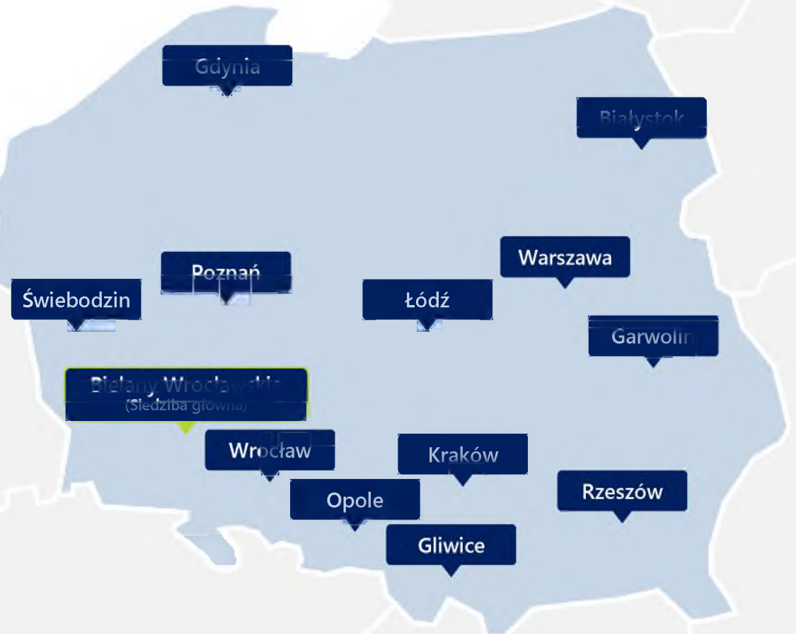
Biura OTTO w Polsce